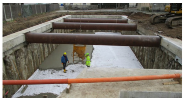
Abb. 3: Bau eines Rückhaltebeckens zur Regenwasserentlastung (Beispielbild), Quelle: Wasserwirtschaftsamt Regensburg