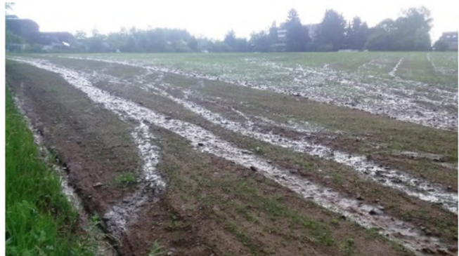
Abb. 1: Oberflächenabfluss und Bodenerosion auf einer Ackerfläche nach einem Starkregenereignis.

Eine Alternative bildet die Mulchsaat (Abb. 2), bei der zwischen Direktsaatverfahren (ohne Bodenbearbeitung) und konservierender Bodenbearbeitung (auf schmalen Fräsestreifen begrenzt) unterschieden wird. Ernterückstände verbleiben nahe der Bodenoberfläche als Mulchdecke, was einer Verschlammung entgegenwirkt und die Versickerung fördert. Dadurch kann der Boden bei Niederschlagsereignissen mehr Wasser aufnehmen und speichern, wodurch der Oberflächenabfluss – und damit auch die Erosion – vermindert beziehungsweise verhindert werden.