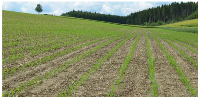
Abb. 2: Durch die Bodenbearbeitung kann die Versickerungsrate erheblich beeinflusst und Erosion verhindert werden: Ackerfläche (Mais) mit Mulchsaat und hangparalleler Bewirtschaftung nach einem Starkregenereignis.