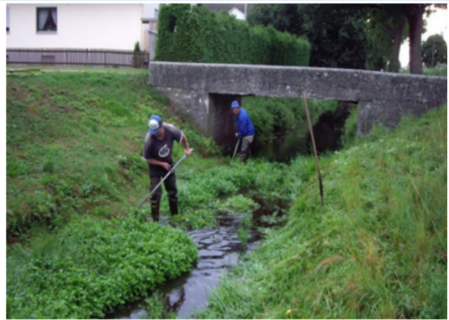
Abb. 2: Freihaltung des Abflussquerschnitts durch Krautung der Gewässersohle.

Alle anfallenden Aufgaben sowie besonders kritische Gewässerabschnitte können in einem Gewässerunterhaltungsplan festgehalten werden (z. B. Abb. 3). Dieser enthält alle relevanten Informationen zur Gewässerunterhaltung innerhalb eines bestimmten Zeitraums.