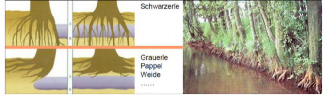
Abb. 1: Ufersicherung; Besondere Eigenschaften der Schwarzerle

In Siedlungsbereichen können ungewollte Abflusshindernisse zu vorzeitigen Ausuferungen des Gewässers führen. Im Bereich von Infrastrukturen sind deshalb regelmäßige Arbeiten in der Gewässerunterhaltung notwendig. In der freien Landschaft sind dagegen Strukturen in und am Gewässer erwünscht. Sie bieten Lebensraum für Tiere und Pflanzen, sichern die Ufer (siehe Abb. 1) und tragen außerdem zum natürlichen Wasserrückhalt in der Fläche bei.