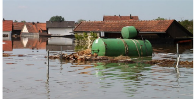
Abb. 1: Aufgeschwommener Dieseltank einer Eigenverbrauchstankstelle beim Hochwasser 2013.

Sobald Wasser in Anlagen zum Umgang mit wassergefährdenden Stoffen (AwSV-Anlagen) oder in Abwasseranlagen eintritt, erhöht sich die Gefahr von zusätzlichen Schäden durch ein Hochwasserereignis (siehe Abb. 1). Sollten Stoffe austreten, besteht die Gefahr der Verunreinigung von Gebäuden, des Gewässers und der Umwelt. Durch Information der Betreiber/ Eigentümer über die Hochwassergefahr können Vorsorgemaßnahmen ergriffen werden.